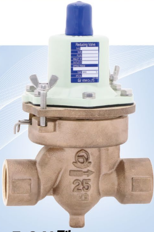
RD-56N型 (呼び径 15 ~ 50)