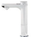
単水栓 取替タイプ(吐水口高さ190ミリ)/シルバー